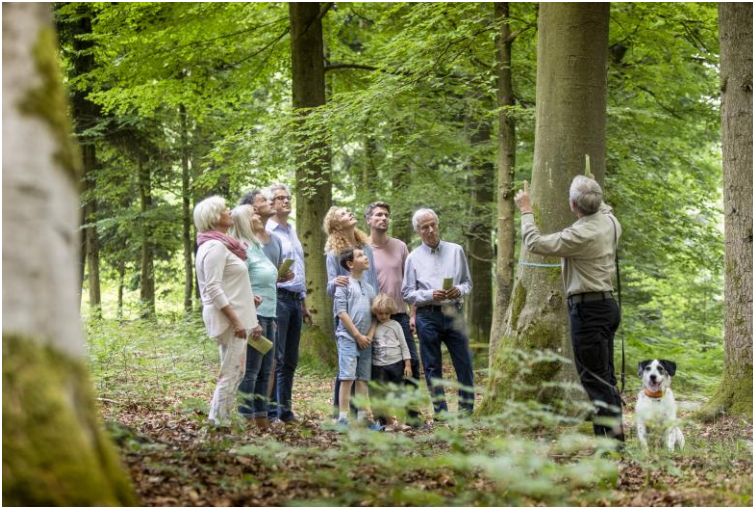
Kostenlose Waldführung im FriedWald.

(Foto: FriedWald, hochauflösendes Foto im Anhang)