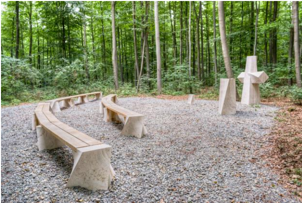
Zentraler Ort des Gedenkens: der Andachtsplatz im FriedWald Bad Berka.

(Foto: FriedWald, hochauflösendes Foto im Anhang)